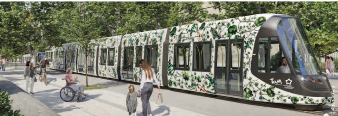
La future Ligne 5