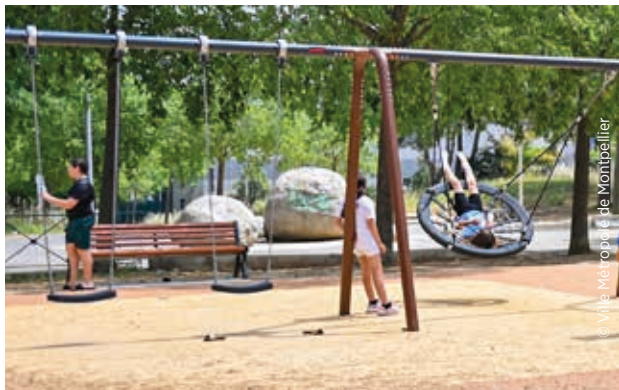
Aire de jeux accessible Georges Brassens