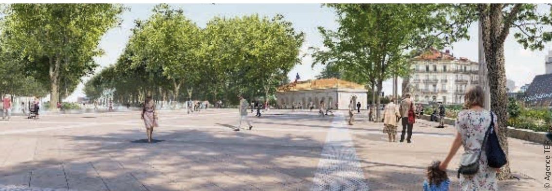
Futurs aménagements Comédie-Esplanade