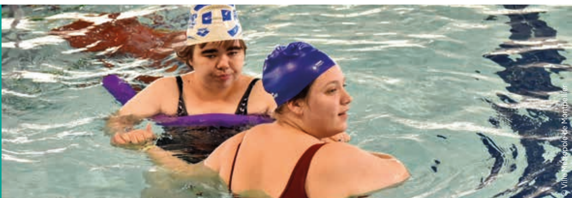
Activités aquatiques piscine olympique Angelotti